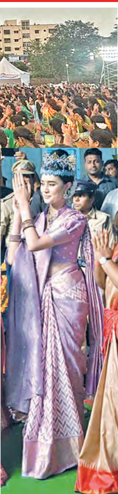
సరూర్ నగర్ లో బతుకమ్మ ఆడుతున్న మినీ వర్ల్డ్ చాపర్, మంత్రి సీతక్క

హైదరాబాద్ (ఎల్.జి.నగర్), సెప్టెంబర్ 29 ప్రభాతవార్త: గల్లీ సుందరి స్థాయి వరకు తెలంగాణ బతుకమ్మ పేరు సాధించింది. తెలంగాణ బతుకమ్మ రెండు గిన్నెస్ వరల్డ్ రికార్డులను సొంతం చేసుకొని అరుదైన రికార్డును సాధించింది. తెలంగాణ రాష్ట్ర ప్రభుత్వం ప్రతిష్టాత్మకంగా చేపట్టిన బతుకమ్మ వేడుకల కార్యక్రమం సరూర్ నగర్ స్టేడియంలో సోమవారం విజయవంతం అయ్యింది. గత రెండు నెలలుగా రాష్ట్ర ప్రభుత్వం చేసిన క పీఠి గిన్నెస్ బుక్ వరల్డ్ రికార్డు