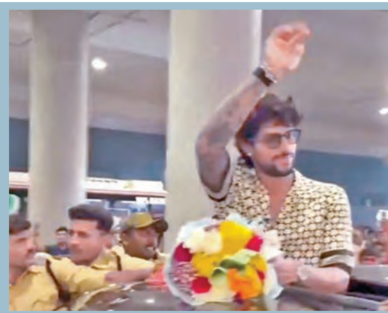
క్రికెటర్ తిలక్ వర్మకు శంషాబాద్ ఎయిర్పోర్టులో స్వాగతం పలుకుతున్న అభిమానులు