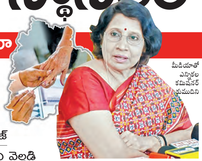
మీడియాతో ఎన్నికల కమిషనర్ కుముదని

హైదరాబాద్, సెప్టెంబర్ 29 ప్రభాతవార్త: తెలంగాణలో స్థానిక సంస్థల ఎన్నికలకు నగరా మోగింది. రాష్ట్ర ఎన్నికల సంఘం (ఎస్ కెసీ) సోమవారం టోటిఫికేషన్ షెడ్యూల్ లోను విడుదల చేసింది. ఇందుకు సంబంధించిన వివరాలను రాష్ట్ర ఎన్నికల కమిషనర్ రాణి కుముదని మీడియాకు తెలిపారు. మొత్తం 5 దశల్లో ఎన్నికలు నిర్వహించనున్నట్లు వెల్లడించారు. మొదటి 2 దశల్లో ఎంపీటిసి, జడ్జీటిసి, మిగత 3 దశల్లో గ్రామ పంచాయతి ఎన్నికలు నిర్వహించనున్నట్లు తెలిపారు. ఎంపీటిసిలకు అక్టోబర్ 23న జడ్జీటిసిలకు 27న రెండో విడత ఎన్నికల పోలింగ్ నిర్వహిస్తామన్నారు. గ్రామ పంచాయతీలకు తొలి విడతగా అక్టోబర్ 31, రెండో విడతగా నవంబర్ 4న మూడో విడతగా నవంబర్ 8 నిర్వహిస్తామన్నారు. పోలింగ్ పూర్తయిన తర్వాత అదే రోజు గ్రామ పంచాయతీలకు ఒక్క లెక్కొచ్చే ఉంటుంది తెలిపారు. నవంబర్ 11న ఎంపీటిసి, జడ్జీటిసి ఓట్ల లెక్కొచ్చే ఉంటుంది అమె తెలిపారు. రాష్ట్రవ్యాప్తంగా 31 జిల్లాల్లోని గ్రామ పంచాయతీలు, వార్డులు, ఎంపీటిసి, జడ్జీటిసి స్థానాలకు ఎన్నికలు నిర్వహించనున్నారు. అయితే, కొన్ని స్థానాల్లో కోర్టువివాదాల కారణంగా ఎన్నికలు వాయిదా పడ్డాయి. ముఖ్యంగా ములుగు, కఠినసగర్ జిల్లాల్లోని