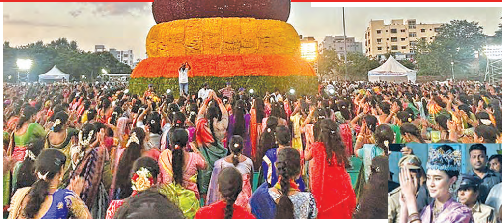
సోమవారం సరూర్ నగర్ లో 'గిన్నెస్ బుక్ కమ్మ' ఆడుతున్న మహిళలు

ఇతర రాష్ట్రాలు, ప్రపంచ దేశాల ముఖ్యమైన పరిణామాలు సామాజిక, ఆర్థిక, రాజకీయ పుస్తక సమీక్షలు ప్రతి ఆదివారం 'వార్త' మెయిన్ లో ఒక పూర్తి పేజీ